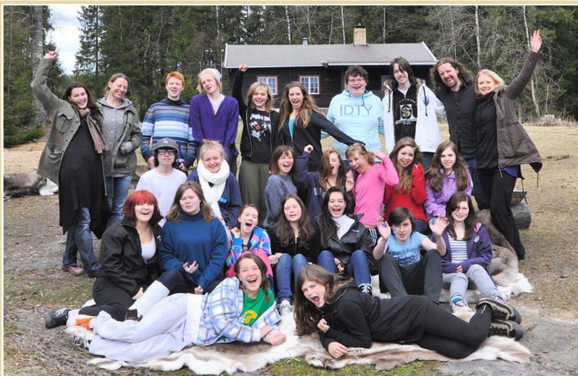
Foto: Holistisk Forbunds konfirmanter våren 2010

Våren 2012 arrangerer Holistisk Forbund konfirmasjon i Stavanger og Oslo. Ungdom i alderen 14-16 år som bor i Oslo-området og Stavanger-regionen kan melde seg på.