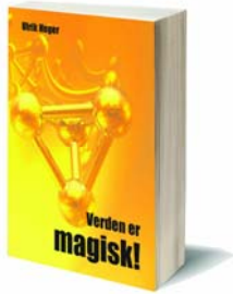
Verden er Magisk

Ny norsk bok bygger bro mellom vitenskap og åndelighet. Ulrik Heger (31) samler innsikt fra flere fagfelt og viser en verden som ikke er kald, materialistisk og logisk, men tvert imot magisk!